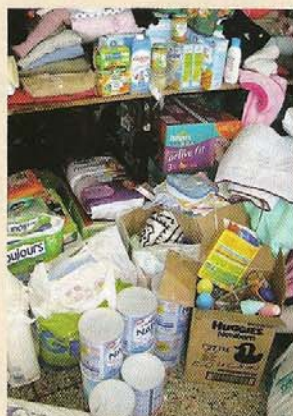
A la salle Béraud, vêtements, produits de toilette, jouets et puériculture sont rassemblés pour être redistribués